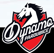
HC Dynamo Pardubice