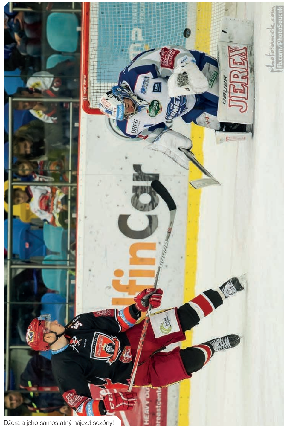
Džera a jeho samostatný nájezd sezóny!