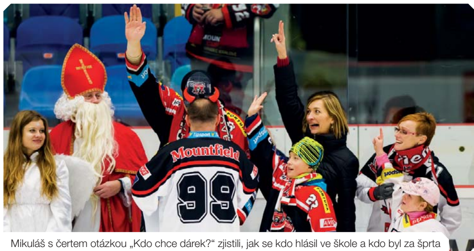
Mikuláš s čertem otázkou „Kdo chce dárek?“ zjistili, jak se kdo hlásil ve škole a kdo byl za šprta