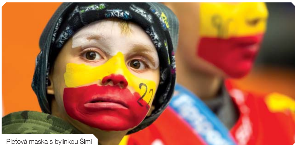
Pleťová maska s bylinkou Šími