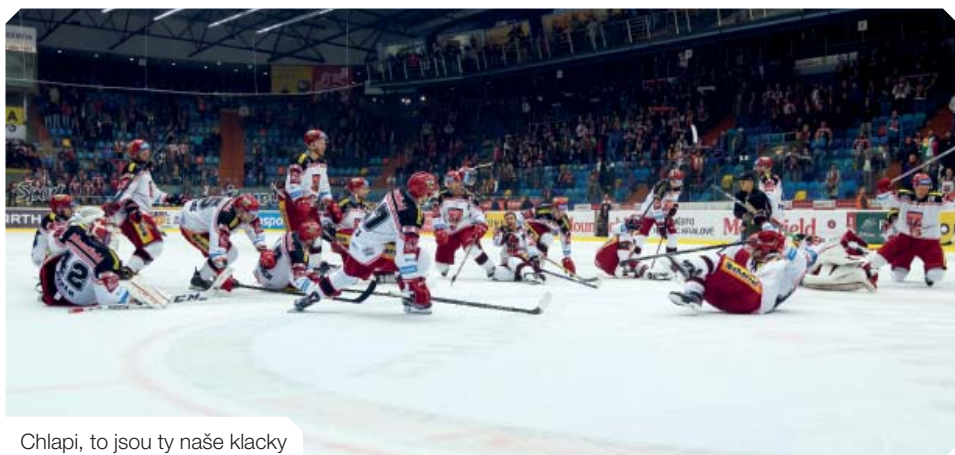
Chlapi, to jsou ty naše klacky