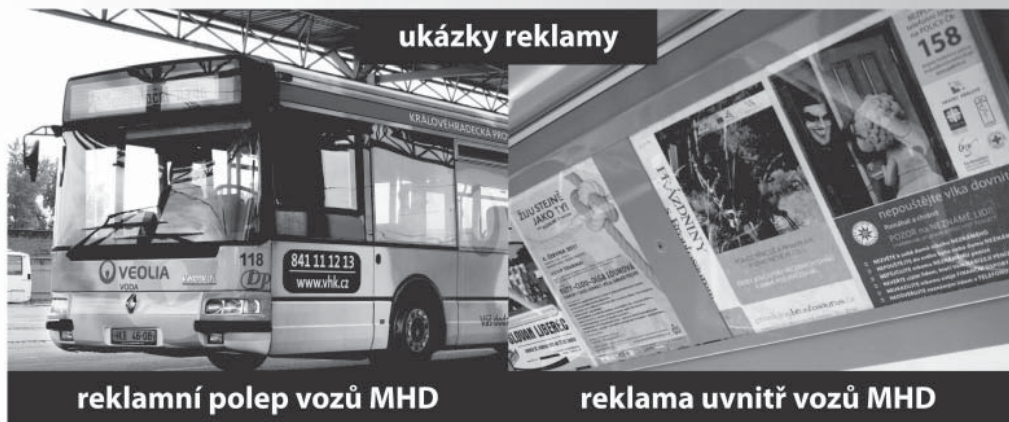
reklamní polep vozů MHD