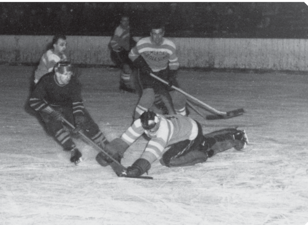
Hradecký útočník Zdeněk Uhlíř před boleslavským brankářem při domácím zápase Spartaků.