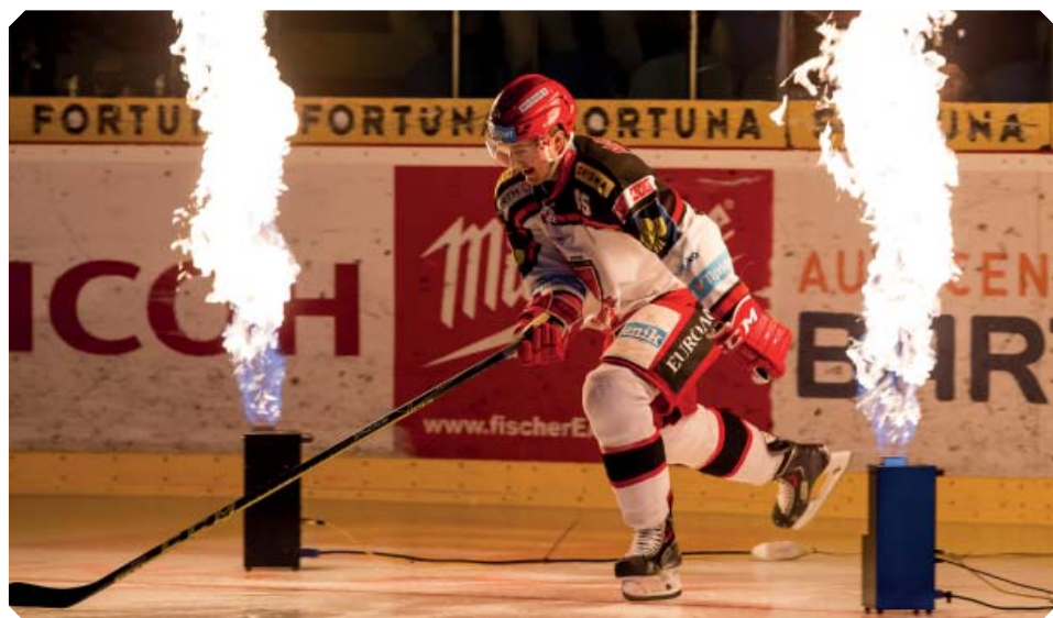
Play off začíná – bude pěkně horko