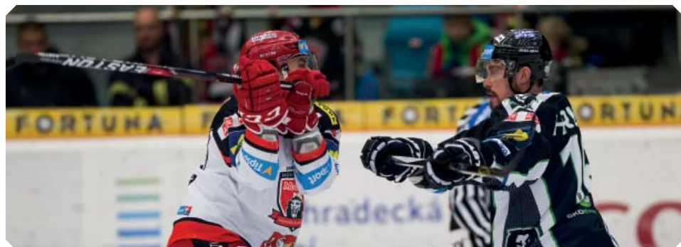
Říkáš přesně na půl?