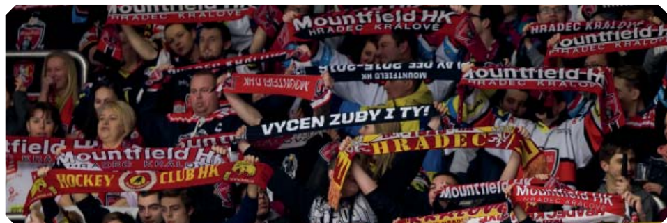
Červená, žlutá, bílá – hradecká síla