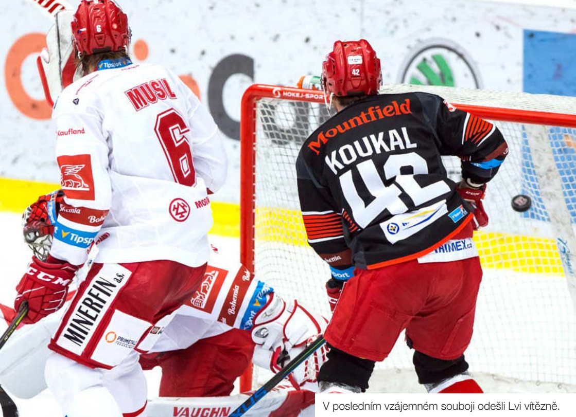
V posledním vzájemném souboji odešli Lvi vítězně.