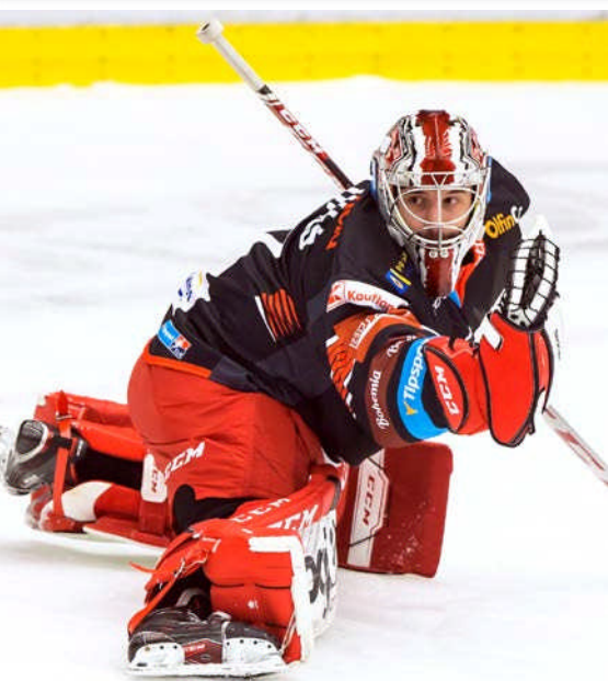
Dojde na souboj...