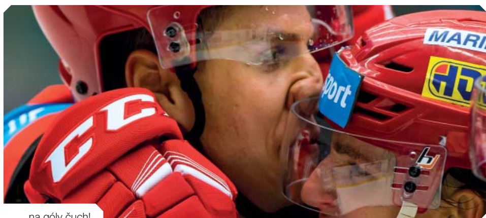
...na góly čuch!