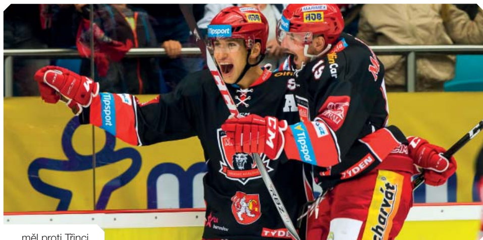
...měl proti Třinci...