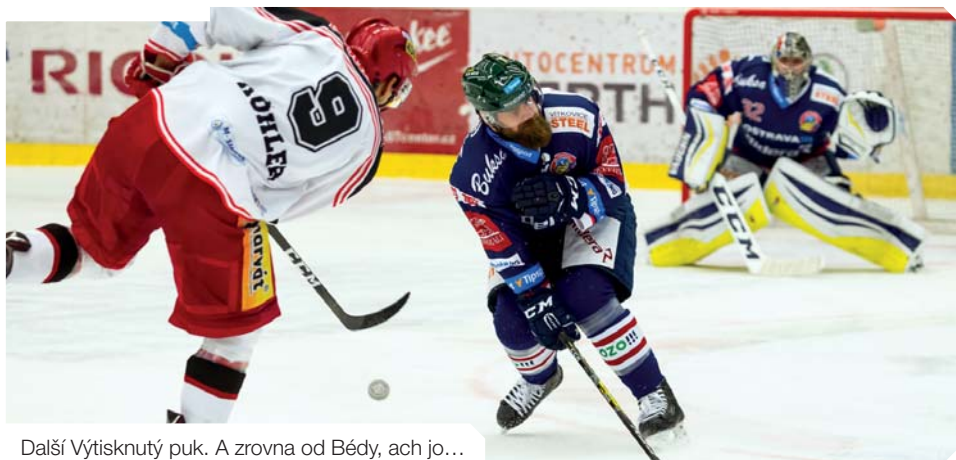
Další Výtisknutý puk. A zrovna od Bědy, ach jo...