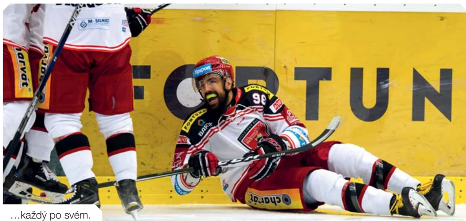
...každý po svém.