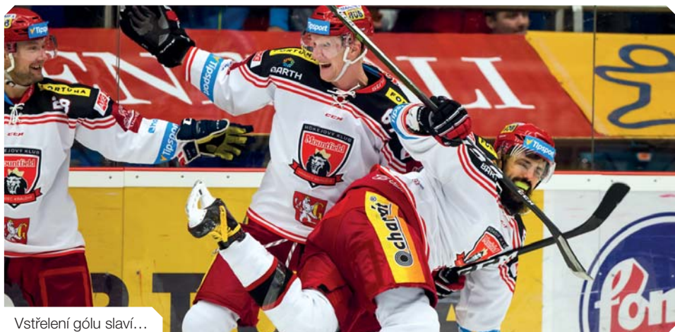
Vstřelení gólu slavi...