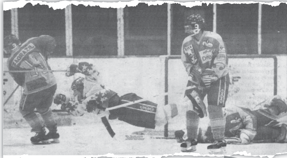
Zápasy proti pražské Slavii patřily k ozdobám národní ligy. Celkem se hradečtí hokejisté utkali s tímto soupeřem v průběhu sezóny devětkrát.