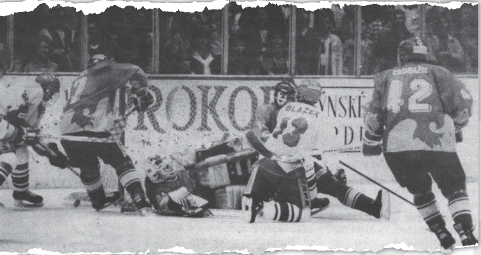
Momentka z derby proti Pardubicím.