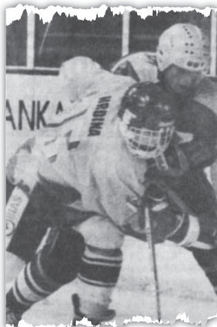
V dresu domovského Hradce nakoukl do extraligy Jan Hrdina, pozdější reprezentant i úspěšný útočník v NHL. Při kanonádě proti Zlínu zaznamenal prvou branku seniorské kariéry.