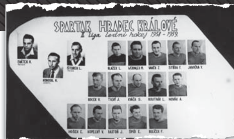
Podobná tabula byla ve své době velice populární možností, jak prezentovat sestavu a uchovat si vzpomínky na kamarády a týmové úspěchy