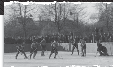
Znovu soubor hokejistů Jičína a Svobodných Dvůrů, tentokrát v prosinci 1953.