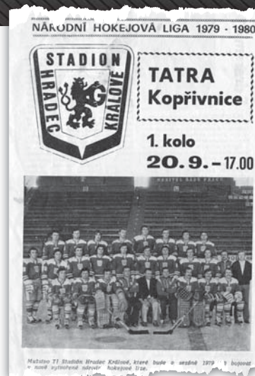
Program vydáný k úvodnímu zápasu sezóny 1979-80

záchranu a v ročníku 1989-90 opět neuspěl ve čtvrtfinále proti Olomouci. Pak se národní liga vrátila k systému finálové skupiny a vyřazovací boje se odehrály až na jaře 1993. To už Hradec dokázal prokletí play-off zlomit. Ale o tom až příště. Je totiž rozhodně na co vzpomínat.