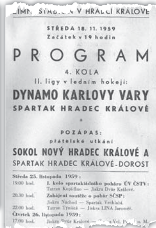
Z prvé stránky programu vydaného k zápasu proti Dynamu Karlovy Vary je vidět hojně využití zimního stadiónu