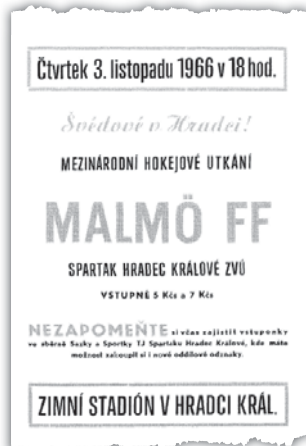
Program vydaný ke sledovanému přátelskému zápasu proti švédskému mužstvu.