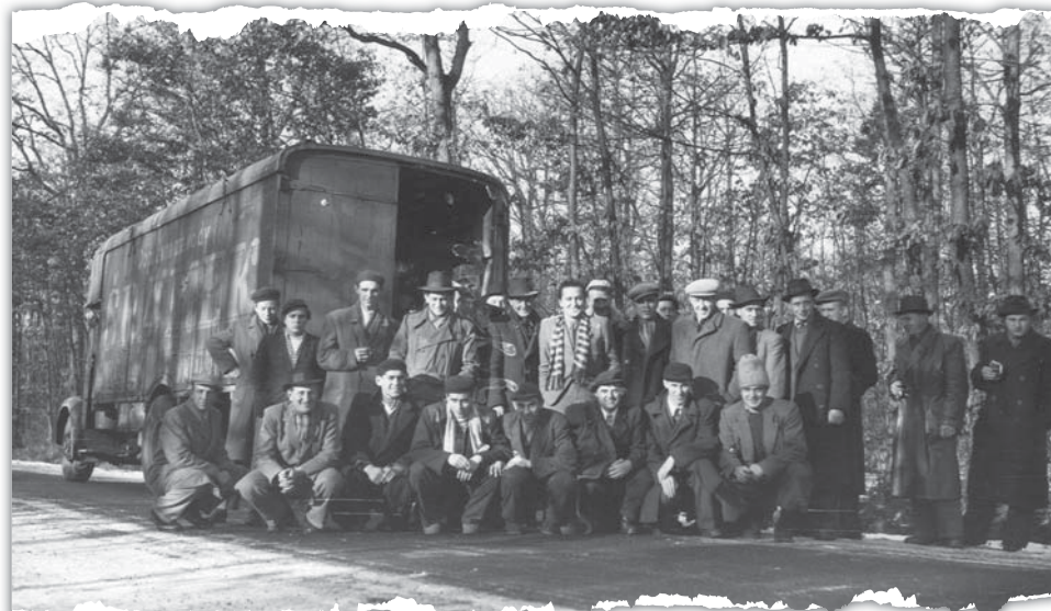
Na zápasy se cestovalo hlavně vlakem, později i na korbách nákladních aut. Na snímku hokejisté Meteoru.