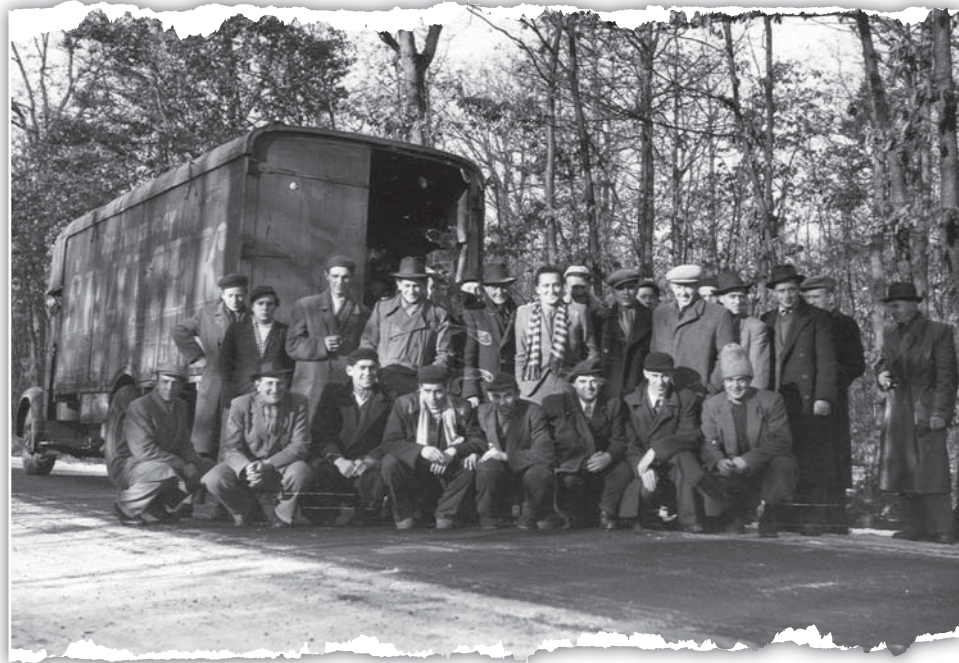
Na zápasy se cestovalo hlavně vlakem, později i na korbách nákladních aut. Na snímku hokejisté Meteoru.

Minule jste si prohlédli na fotografiích místa, kde se v Hradci Králové hrál hokej předtím, než byl postaven zimní stadión. Chronologicky plynoucí vyprávění jsme zakončili tím, že teplá zima 1947-48 znamenala anulování hokejových soutěží. Se závěrem nedohrané sezóny přichází i 25. únor 1948, který znamenal společenské změny, které se dotkly i tělovýchovy, tedy i ledního hokeje. Ještě v sezóně 1948-49 si například hokejisté ze Svobodných Dvorů udrželi své jméno, ale další ročník už zahajovali jako ZSJ RDP, tedy Základní sportovní jednota Rolnického družstevního podniku. Svou kvalitu nadále ukazovali i kuklenští hokejisté, kteří navíc krátce po únorovém převratu přešli do ZSJ Škoda. V sezóně 1950-51 už působí v Oblastní soutěži spolu s hokejisty ze Svobodných Dvorů, v následující zimě už i s mnohými bývalými hráči Meteoru dominují nejen hradeckému hokeji, ale vyhrávají krajský přebor a to znamená postup do kvalifikace o nejvyšší