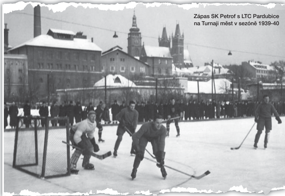
Zápas SK Petrof s LTC Pardubice na Turnaji měst v sezóně 1939-40